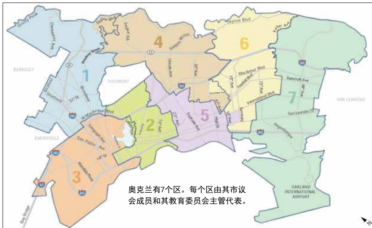
奥克兰有7个区。每个区由其市议会成员和其教育委员会主管代表。

在此次选举中，所有的奥克兰选民可以对市议会代表全市的议员候选人以及市律师候选人进行投票。住在1, 3, 5, 7区的奥克兰选民可以对市议会以及教育委员会的候选人进行投票。